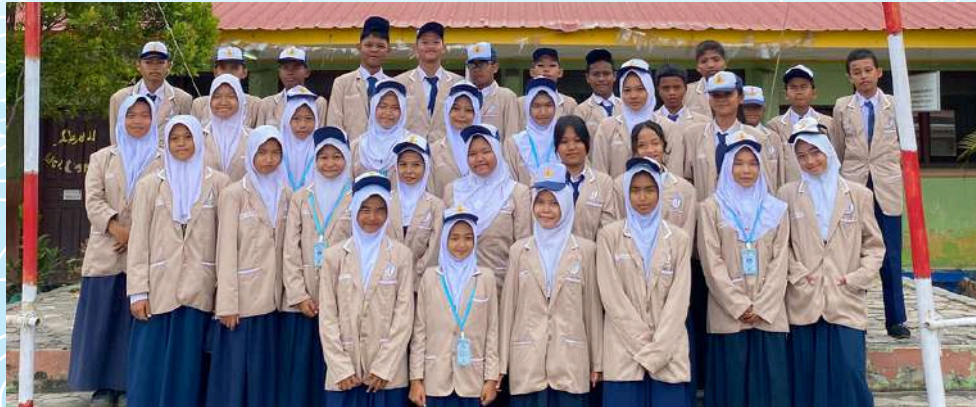
Anggota Osis SMP N 23 Dumai 2025-2026